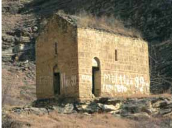
მე-11 საუკუნის ქართული ეკლესია დათუნა დაღესტანში.

სვანეთი XI-XIII საუკუნეებში ვითარდებოდა, როგორც ჩრდილო კავკასიიდან ქვეყნის დაცვის და, ამავე დროს, ჩრდილო კავკასიის მიმართულებით ქვეყნის საზღვრების გაფართოების ცენტრი. სვანეთის კოშკების ყველა კომპლექსი ამ პერიოდშია აშენებული. ამ პერიოდში აშენებული კოშკები შუა საუკუნეების არქიტექტურის ნიმუშებია არა მარტო იმის გამო, რომ არც ერთი კოშკი არ დანგრეულა მიწისძვრის ან ზვავის შედეგად, არამედ, მშენებლობის ტექნიკის გამოც: ზოგიერთი კოშკის ზედა მხარეც კი რამდენიმე ტონიანი ქვებითაა ნაშენები.