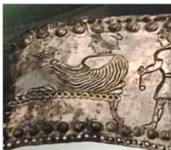
სიმპოზიუმის სცენის ფრაგმენტი