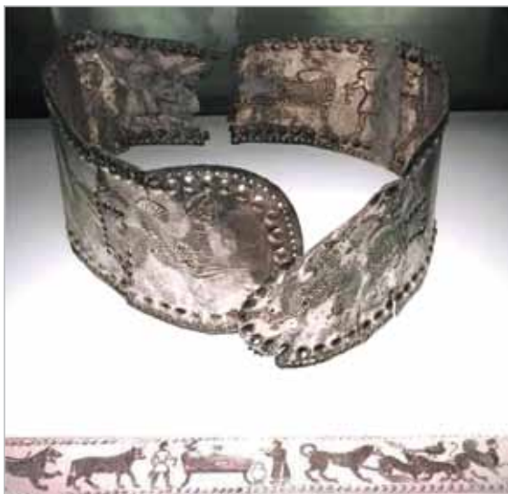
ვერცხლის ქამარი, ვანის 24-ე სამარხიდან, სიგანე: 10.8 სმ, სიგრძე: 85.2 სმ. © დაცულია საქართველოს ეროვნულ მუზეუმში (ოქროს ფონდის დარბაზში № 24-2006:28).