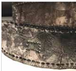
სცენა, ლომი მისდევს ხარს. ქამარზე თასმის ბალთისთვის დატანებული ხვრელები