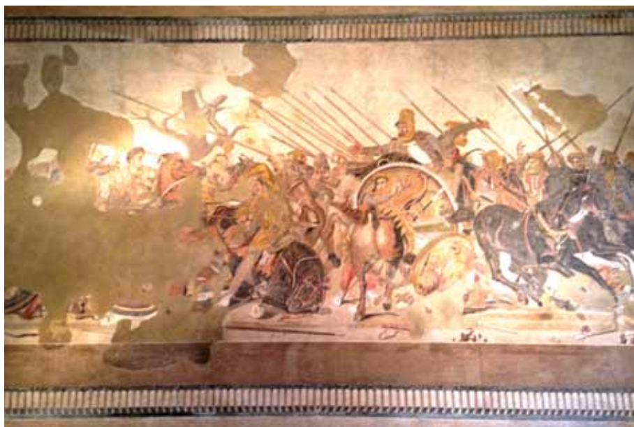
ალექსანდრე მაკედონელის მოზაიკა, პომპეის ფავნის სახლიდან, ნეაპოლის ნაციონალური არქეოლოგიური მუზეუმი