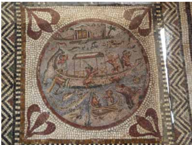
კომპოზიცია ნილოსის თემაზე, მოზაიკა, ნეაპოლის ნაციონალური არქეოლოგიური მუზეუმი