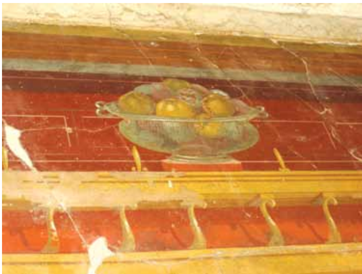
ვაშლები მინის ჯამში, პოპეას ვილის კედლის მხატვრობა