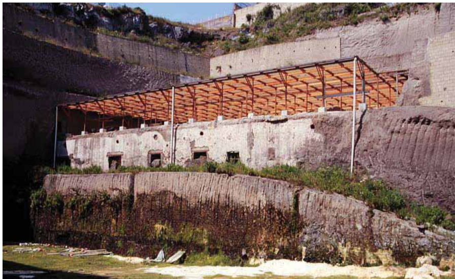
პაპირუსის ვილა, შერკულანუმი