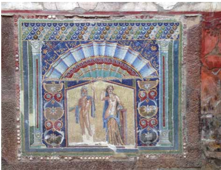
ნეპტუნის და ამფიტრიტას მოზაიკა, ჰერკულანუმში