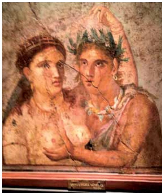
აპოლონი და ნიმფა, კედლის მხატვრობა ნეაპოლის ნაციონალური არქეოლოგიური მუზეუმი