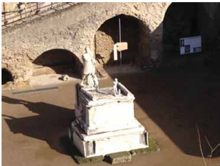
მარკუს ნინიუს ბილბუსის ქანდაკება ჰერკულანუმში