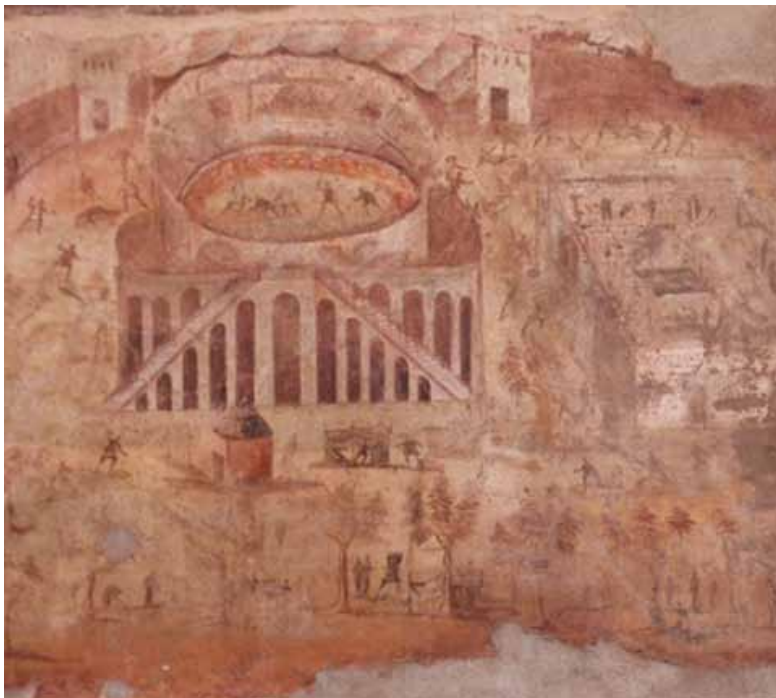
არეულობა პომპეის ამფითეატრში, ფრესკო, ნეაპოლის არქეოლოგიური მუზეუმი