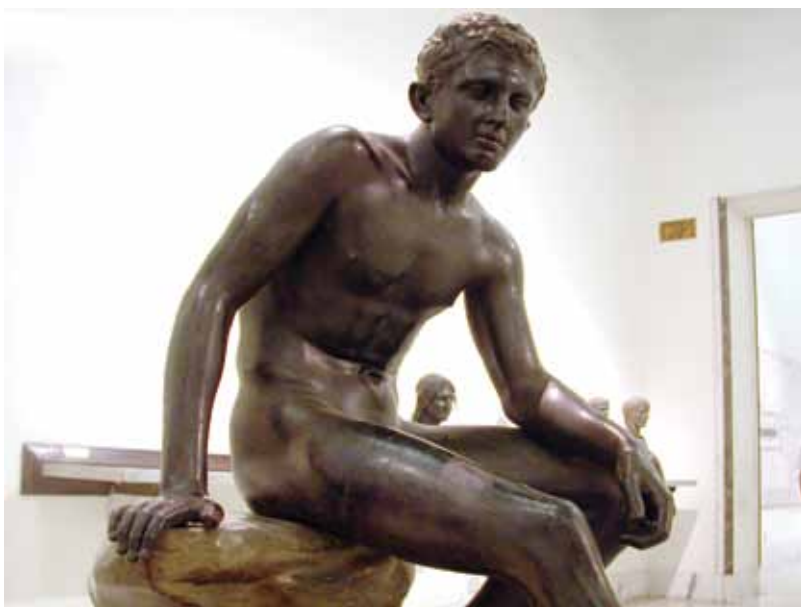
მჯდომარე შერმესი, ბრინჯაო, შერკულანუმიდან, ნეაპოლის ნაციონალური არქეოლოგიური მუზეუმი