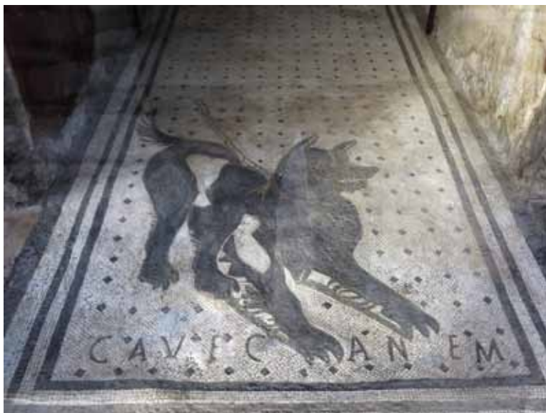
CAVE CANEM, მოზაიკა, პომპეი