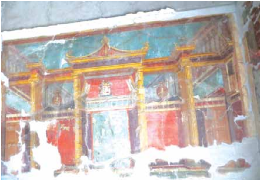
არქიტექტურული ლანდშაფტი, პომპეას ვილის კედლის მხატვრობა