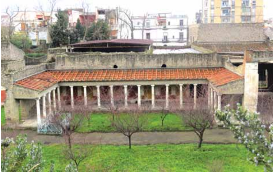
პოპეას ვილა, ოპლონტისი (სანტა ანუნციანა)