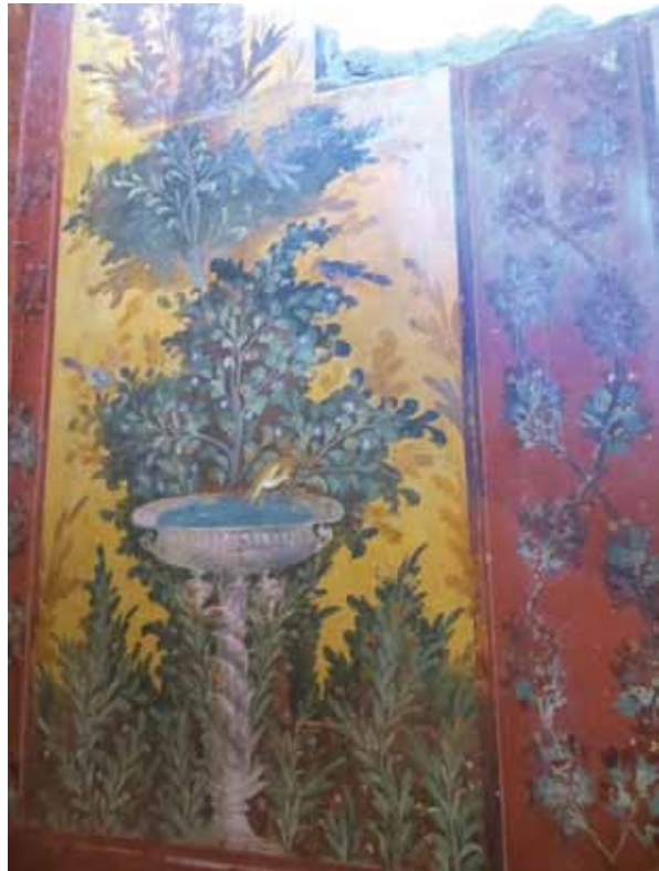
დეკორატიული ბადი, პოპეას ვილის კედლის მხატვრობა