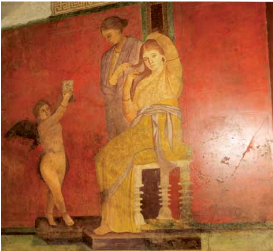
პომპეის მისტერიების ვილის კედლის მხატვრობის ფრაგმენტი