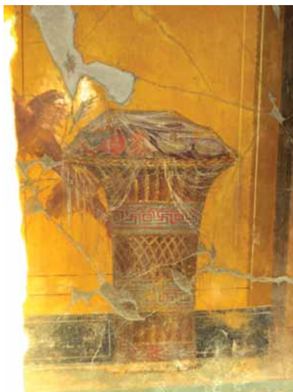
ხილით სავლე კალათა, პოპეას ვილის კედლის მხატვრობა